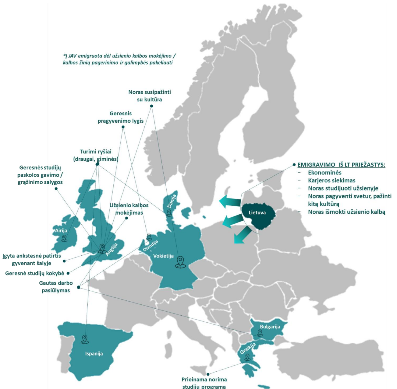
Pav. 2.1.1 Tyrimo dalyvių pasirinktos emigracijos kryptys bei emigravimo priežastys